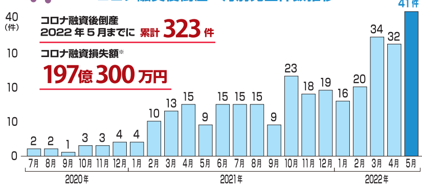
コロナ融資後倒産 月別発生件数推移

来年にはコロナ融資の無利子期間が終了になるため、利払いが始まり、それによって各企業の資金繰りはさらに厳しくなることが予想されます。